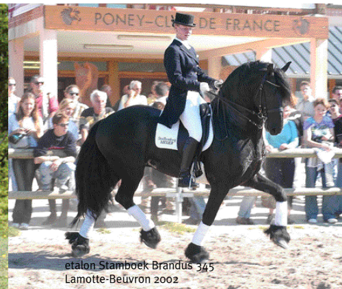
Etalon Stamboek Brandus 345 Lamotte-Beuvron 2002