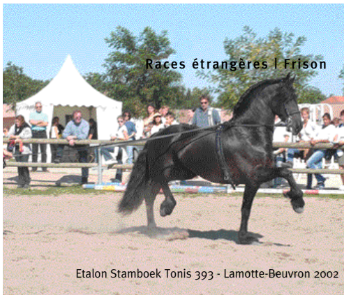
Races étrangères | Frison